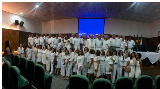
Aula da saude realizada no auditório do CREMAM

Após uma breve visão da realidade atual do câncer de próstata gostaria de alertar vocês, colegas médicos, que realizem seus exames e cuidem de sua saúde pois o câncer de próstata quando diagnosticado precocemente tem chances de cura elevadas, no entanto quando diagnosticado tardiamente pode ser uma doença letal.