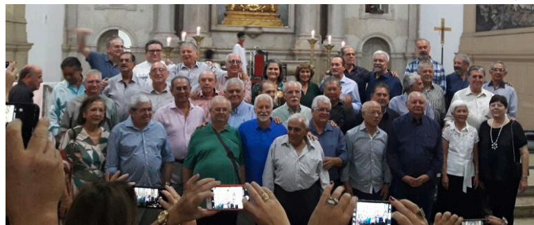
Missa de Ação de Graças pelos 45 anos de formados da Turma de 1972