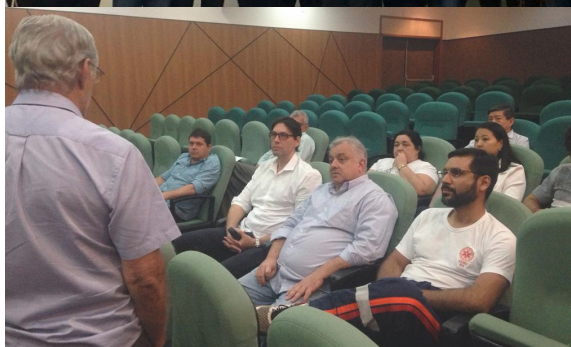
Palestras sobre Declaração de Óbito