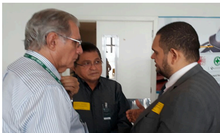
Inspeção no Hospital e Pronto-Socorro Delphina Aziz