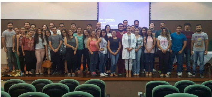
Palestrante com os Formandos de Medicina da UEA