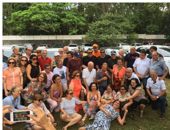
Confraternização da Turma de 1977