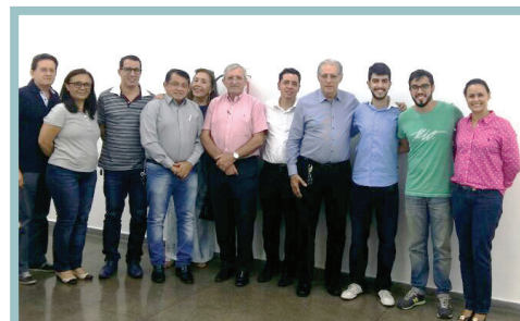
Discentes de Medicina, com coordenadora docente e membros da diretoria do CREMAM